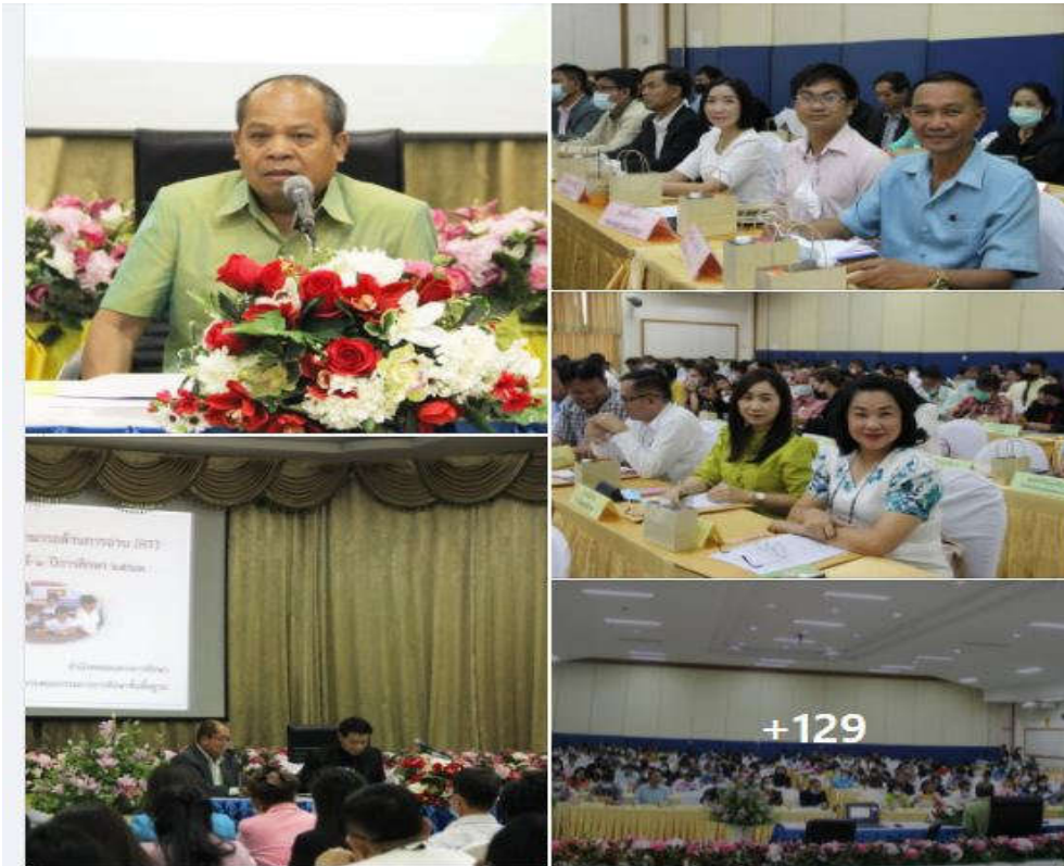
ประชาสัมพันธ์ สพป.หนองบัวลำภู หนึ่ง ได้เพิ่มรูปภาพใหม่ 133 ภาพลงในอัลบั้ม: ชี้แจงการประเมิน NT และ RT ปีการศึกษา 2563